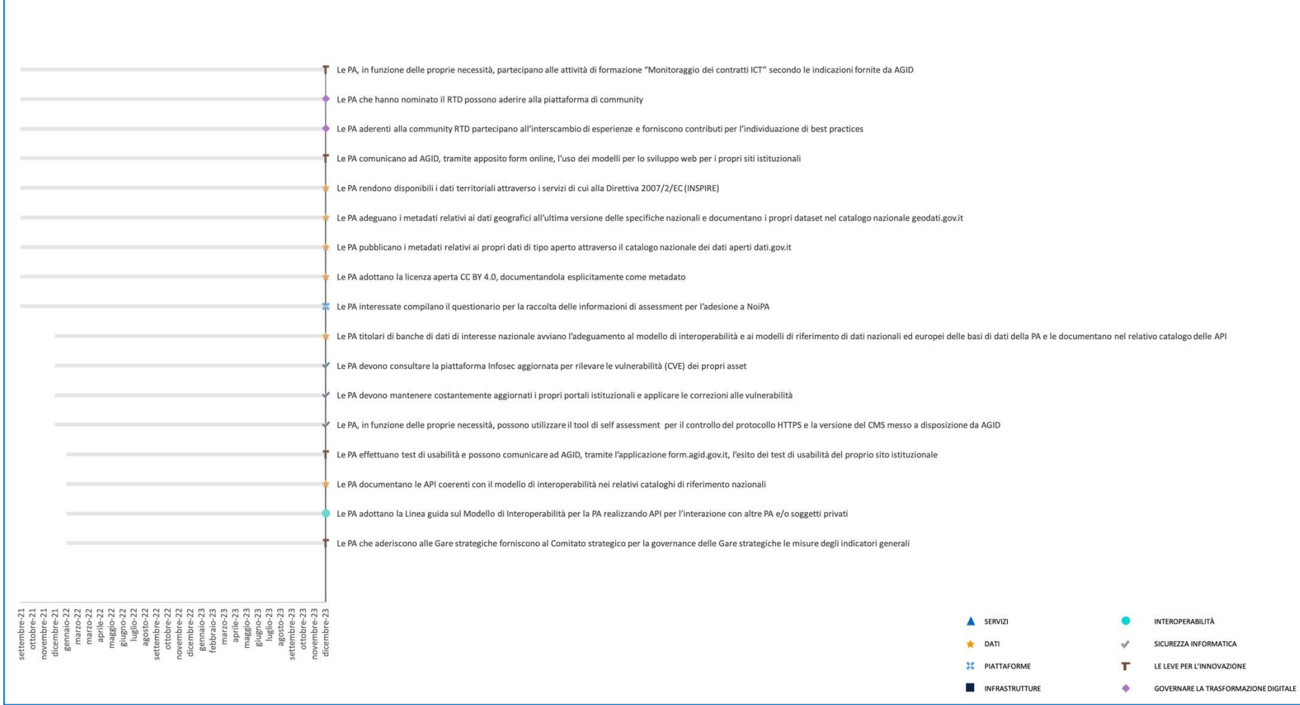
Figura 5 – Azioni 2021 - 2023 a carico di tutte le PA (3 di 4)