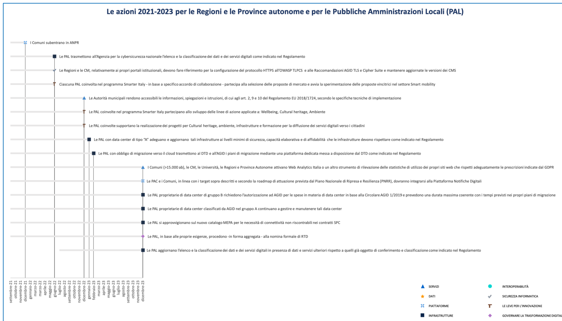
Figura 8 - Azioni 2021-2023 a carico delle Regioni, delle Province autonome e delle PA locali