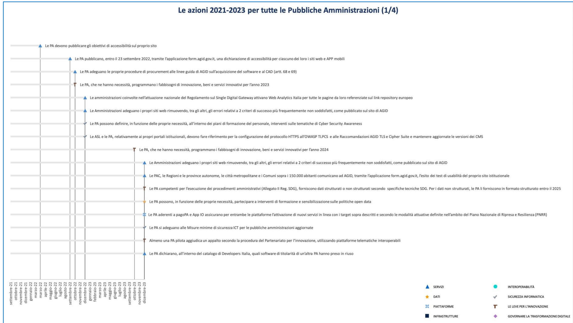
Figura 3 – Azioni 2021 - 2023 a carico di tutte le PA (1 di 4)